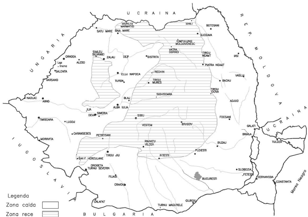
Fig. 9 – Zonare climatică

5.4 Adezivitatea se determină obligatoriu atât prin metoda cantitativă descrisă în SR 10969 (cu spectrofotometrul) cât și prin una dintre metodele calitative - conform SR EN 12697-11 sau normativ NE 022.